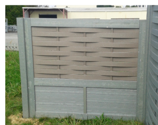
Réf. : CDT-145