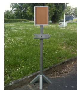
Réf. : PI-A